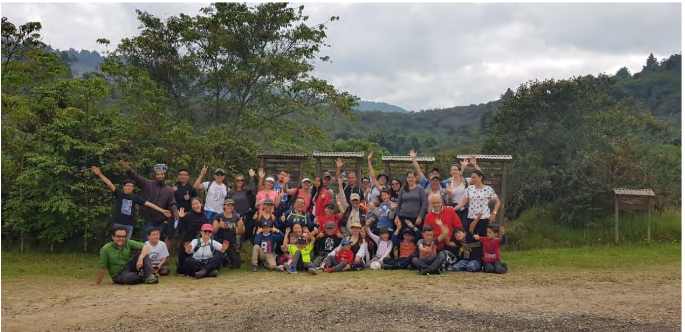
TERCERA CAMINATA GIMNASIANA – PARQUE LA POMA

Las fuentes principales de ingresos de la Asociación durante el 2020 fueron los aportes por concepto de afiliaciones que realizaron las familias y las contribuciones por programas. El efectivo disponible del ejercicio 2020 inició con el saldo en Caja y Bancos equivalente a $8.606.463 y terminó con un saldo final de $6.402.626. Durante el año, se percibió la suma de $1.930.000 por concepto de afiliaciones 2019-2020 y programas para el desarrollo de su objeto social. Los ingresos por concepto de afiliaciones del período académico 2020-2021 por valor de $5.540.000 se destinaron para el ejercicio 2021.